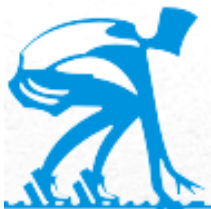
Punto de partida

Desde este punto de partida, puedes realizar una lista ordenada de aquellas ocupaciones adecuadas a tus características personales, profesionales y a tu situación personal, colocándolas según tus preferencias y prioridades.